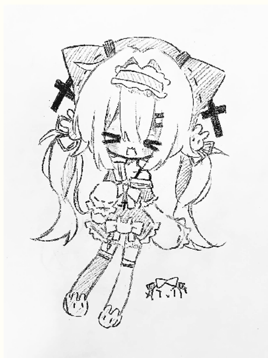
小记者:王雨萌 周口市六一路小学二(6)班 辅导老师:李小明