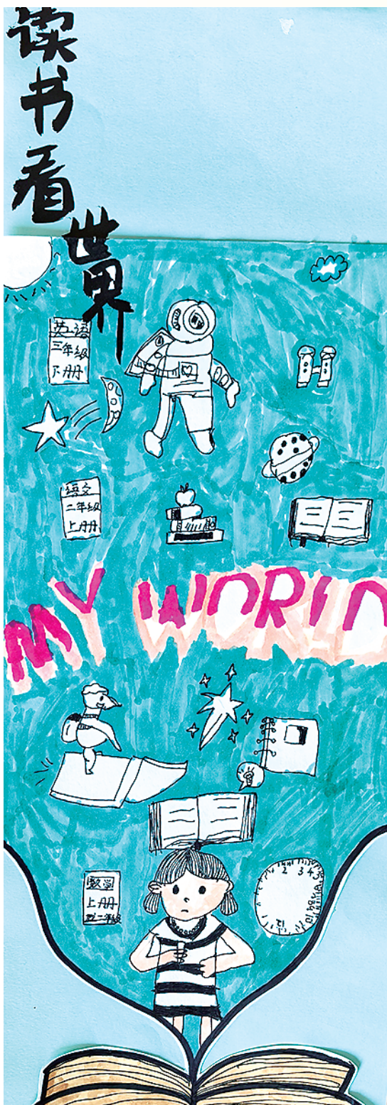
小记者:张钰甯 周口市六一路小学二(6)班 辅导老师:李小明